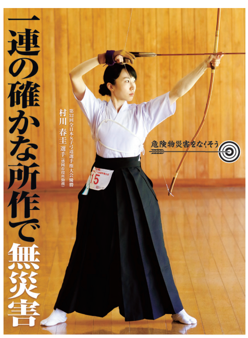
消防庁／都道府県／市町村／全国消防長会／一般財団法人全国危険物安全協会 危険物安全週間推進ポスター

また、地域の防火防災意識の高揚を図る上で、自主防災組織の育成とともに、女性防火クラブ、少年消防クラブ、幼年消防クラブ等の育成強化を図ることも重要である。