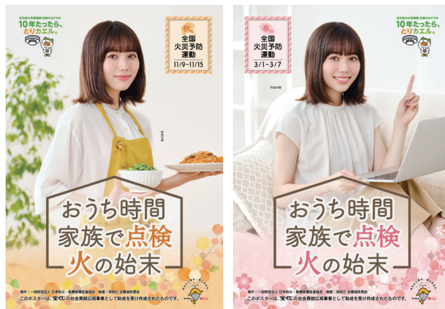
火災予防運動ポスター

また、令和4年3月1日から7日まで実施した令和4年春季全国火災予防運動では、秋季と同一の全国統一防火標語の下に、秋季の取組に、「林野火災予防対策の推進」を加え様々な行事が実施された。