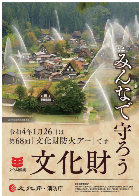
文化財防火デーポスター

消防庁では、文化財等における訓練の実施方法を具体化した「国宝・重要文化財（建造物）等に対応した防火訓練マニュアル」を作成しており、文化財防火デー等の機会を捉え、文化財等の関係者における実践的な訓練の実施を促進している。